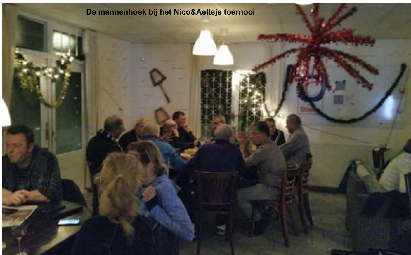
De mannenhoek bij het Nico&Aeltsje toernooi